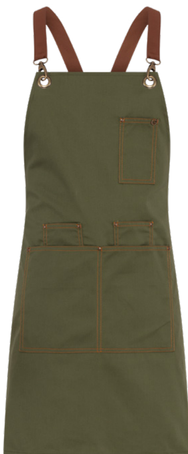
Z43 Verde militare